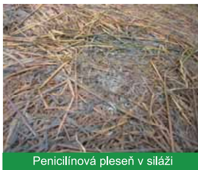
Penicilínová pleseň v siláži