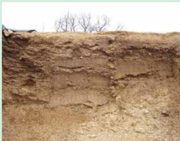
Brackenhurst College, Nottingham Analýza GPS (celoobilninové krmivo)