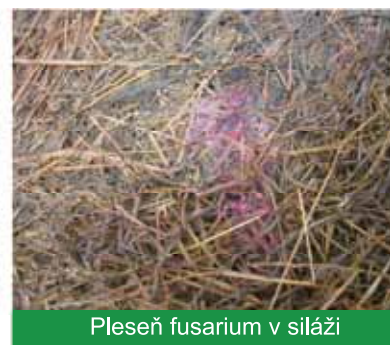
Pleseň fusarium v siláži

Spočiatku sa po expozícii prežívavcov mykotoxínom neobjavujú žiadne účinky, avšak ak pokračuje konzumácia mykotoxínov ďalšie dni a týždne, môže to spôsobiť celú radu problémov, napríklad: