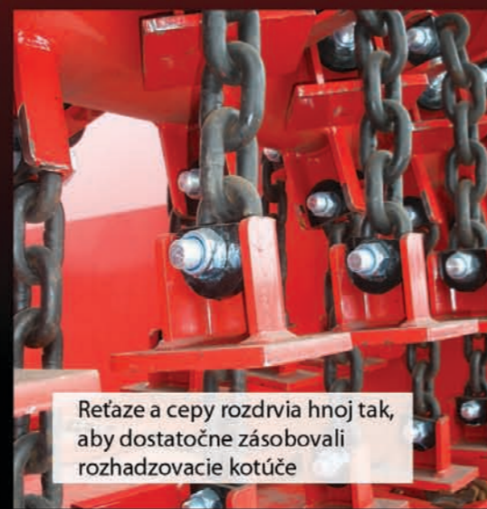
Reťaze a cepy rozdrvia hnoj tak, aby dostatočne zásobovali rozhadzovacie kotúče