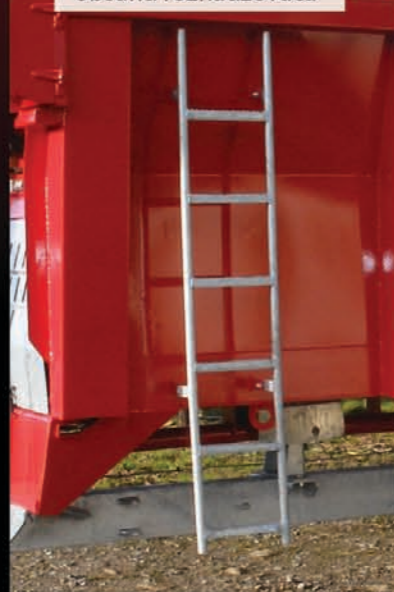
Rebrík pre kontrolu obsahu rozhadzovača