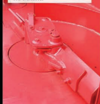
Rozhadzovacie kotúče s priemerom 960 mm, chránené špeciálnymi skrutkami