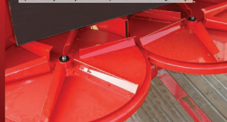
Rozhadzovacie kotúče na jemný/suchý hnoj, príklad, hydínový trus, kompost, močovkové granuly