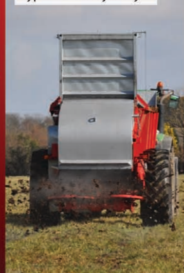
Vyprázdňovacia brána a ukazovateľ výšky vyprázdňovacej brány