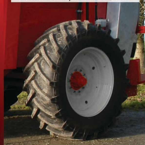
Veľké radiálne pneumatiky 580/70 R38 znižujú riziko stlačenia a opotrebovania behúňov