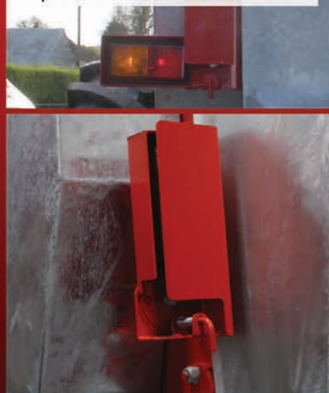
Koncové svetlá a dopravné ukazovatele s krytmi na ochranu pri rozhadzovaní